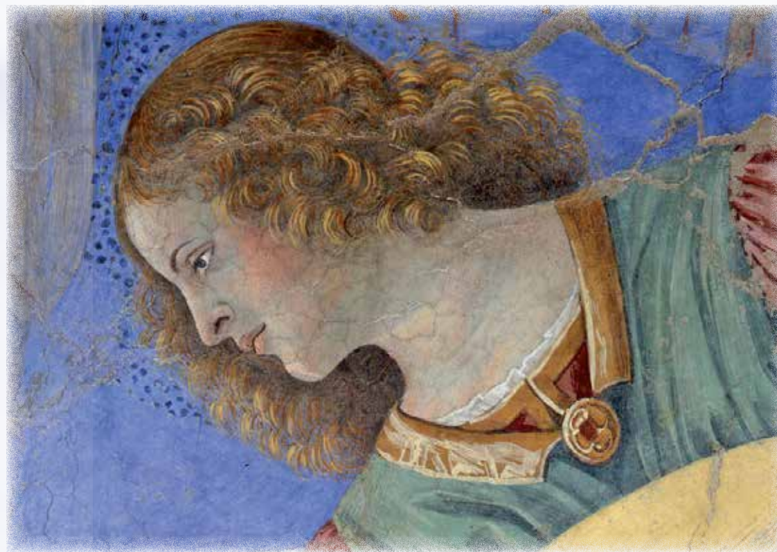
Particolare di "Angelo che suona il liuto" di Melozzo da Forlì, 1472, affresco, Pinacoteca vaticana, Città del Vaticano.

mo Arcangelo – in questo caso Metatron – un accenno alle caratteristiche della Sefira dell'Albero della Vita da Lui governata e il suo Coro di 8 Angeli, con le descrizioni relative a ciascuno di loro. 9 i Cori angelici e 72 gli Angeli, aventi il compito di assisterci come 'custodi'. Personalmente intendo l'essenza di un Angelo Custode come la potenzialità di Luce della persona, così come essa è la realizzazione e l'incarnazione di certe vibrazioni e frequenze.